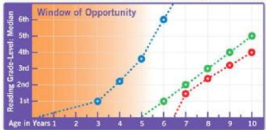
Key: YBCR System readers* Standard age readers** Late age readers** * Based on information from children who were tested after learning to read using Your Baby Can Read! ** Cited from scientific studies.